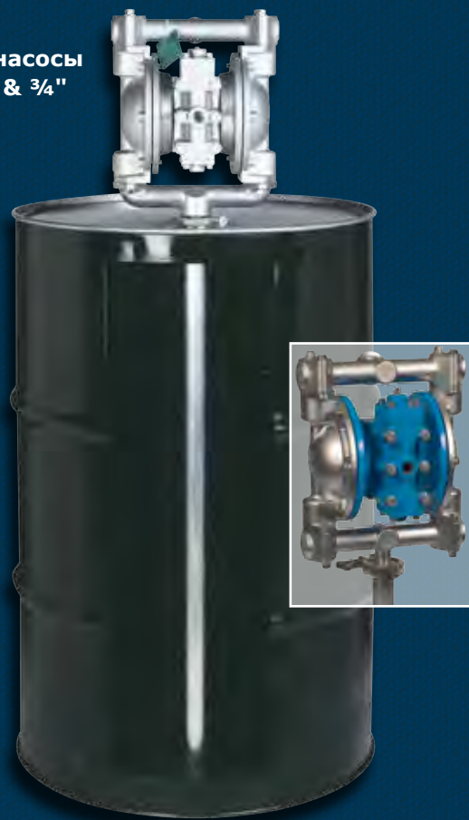
Бочковые насосы 3/8", 1/2", & 3/4"